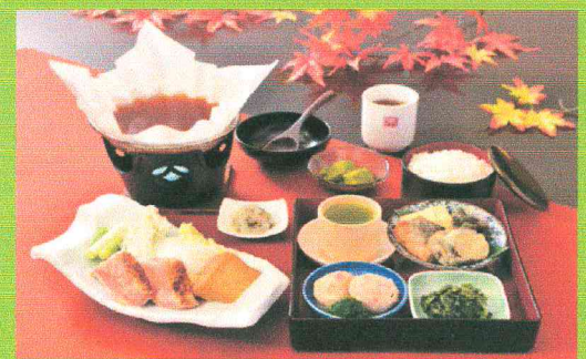
秋の和み膳(イメージ)