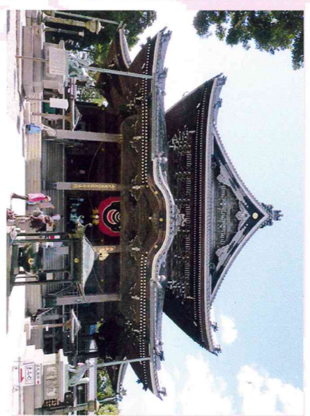
写真左: 豊川稲荷 右: うなぎパイファクトリー/イメージです