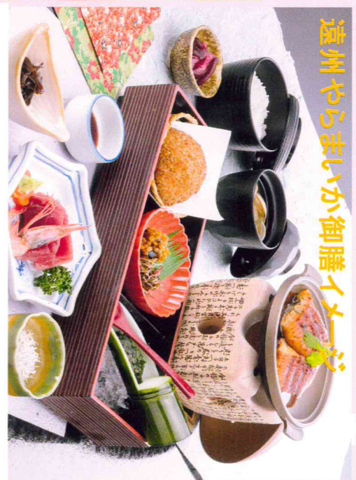
遠州 やらまいか御膳 イメージ