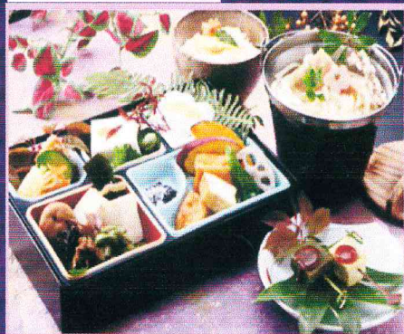
昼食イメージです