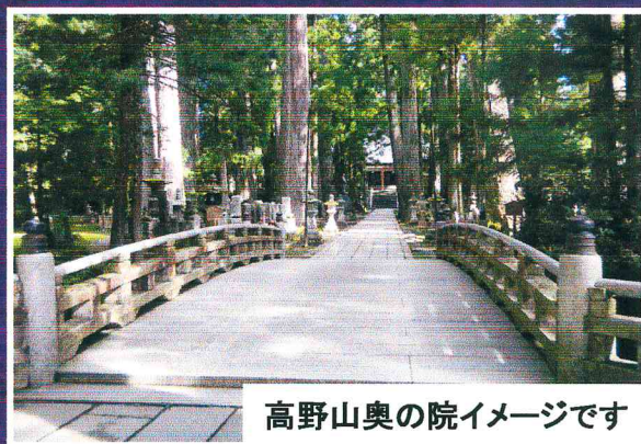
高野山奥の院イメージです