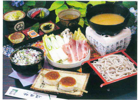
※食事イメージです