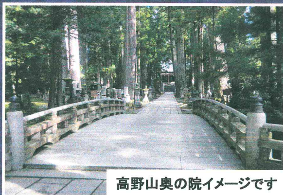
高野山奥の院イメージです