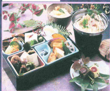
昼食イメージです